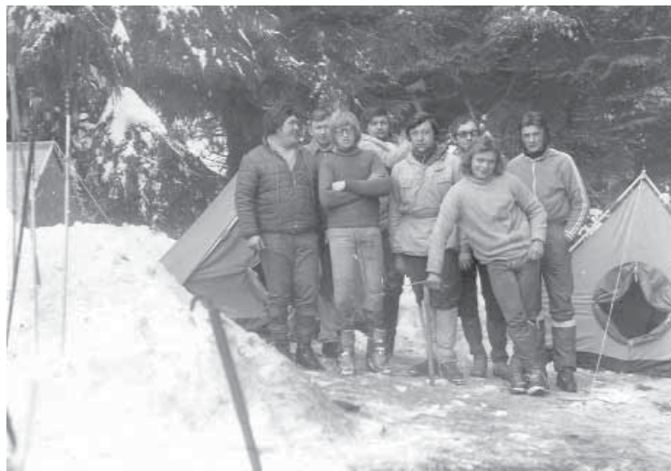
Zimný výstup na Sľubicu - 1. ročník - stanový tábor na vrchole