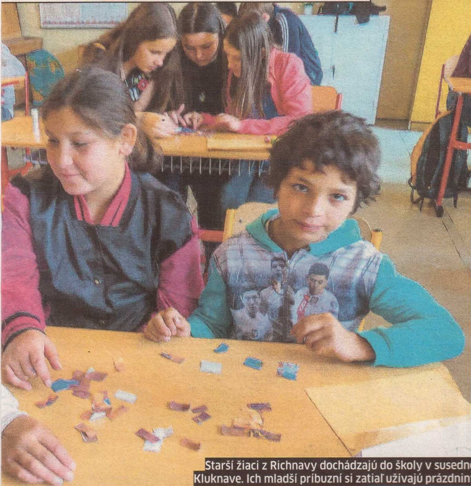
Starší žiaci z Richnavy dochádzajú do školy v susednej Kluknave. Ich mladší príbuzní si zatiaľ užívajú prázdniny.