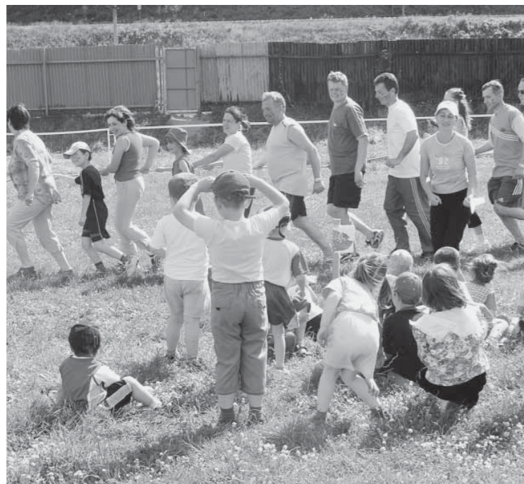
Športové dopoludnie pri príležitosti medzinárodného dňa detí 2005.

» Výkonnostný a vrcholový šport sú činnosti vymedzené pravidlami, osvojené v tréningovom procese, uskutočňované v súťažiach